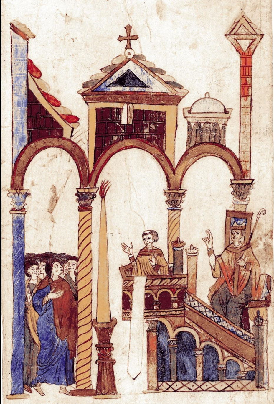
Exultet, Parigi, BNF, nal 710 (Fondi, 1135ca)