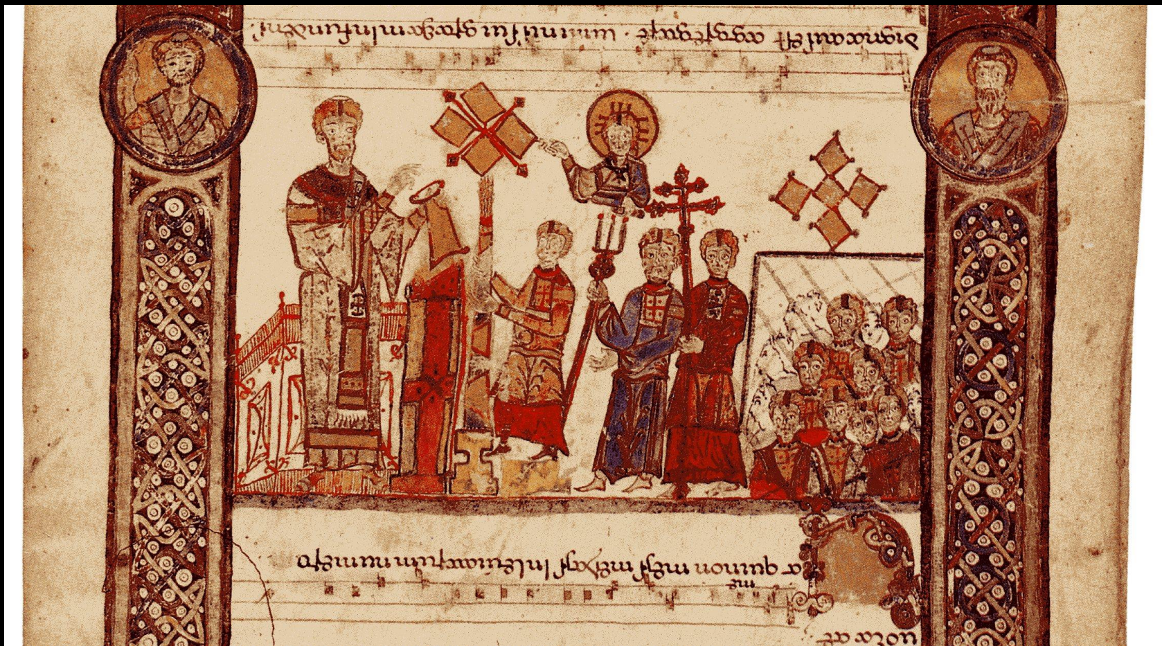
Exultet, Bari 2(sec. XI, II metà): particolare dove è visibile l'arundine