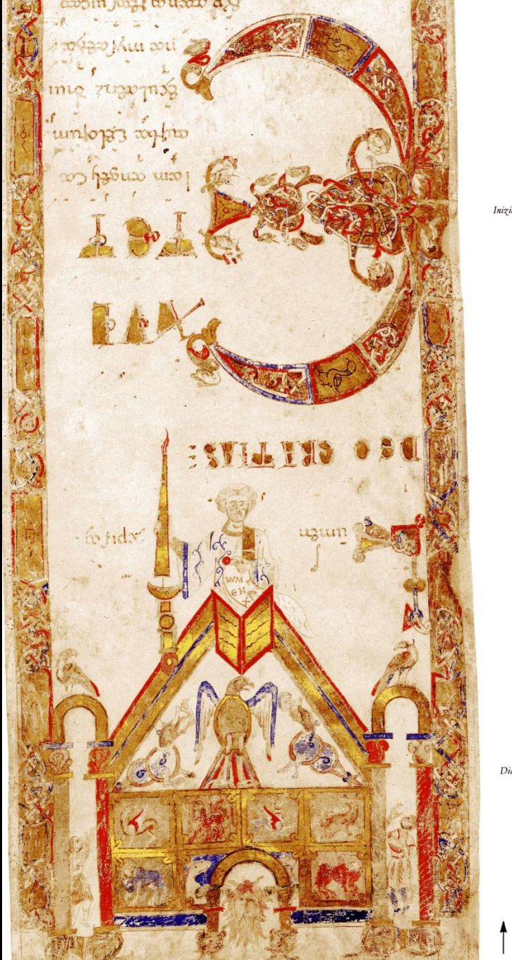
Pisa, Exultet 2