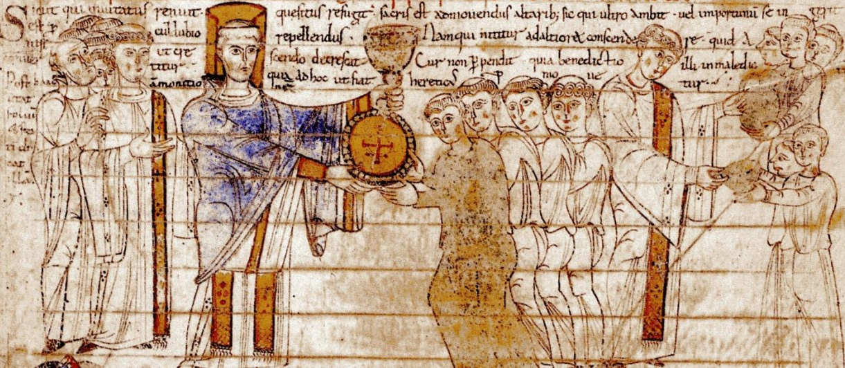
Benevento Pontificale, Roma, Cas 724 (B I 13) 1 (969)

& gſſe miſericordiam ſuam uſtruat conſirma: per: Subdiaconi accipiant de manu epi patenam uacua & calicem uacuum de manu epi ac thidiae con: uſtra cum aqua uinile & manuet gſo: pſephaeo ſubdiae. In ſono lae.