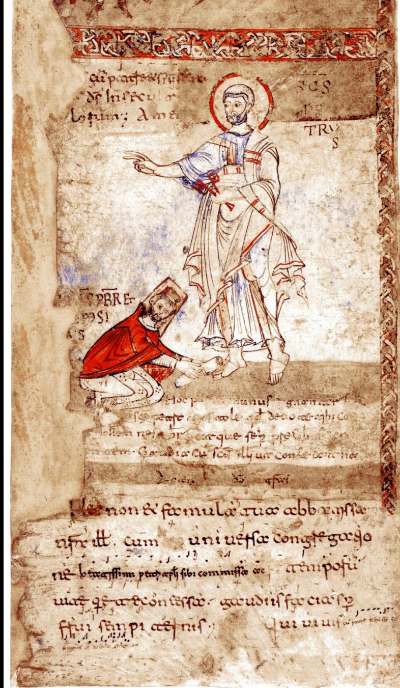
Offerta del rotolo a San Pietro da parte del presbitero Iohannes.