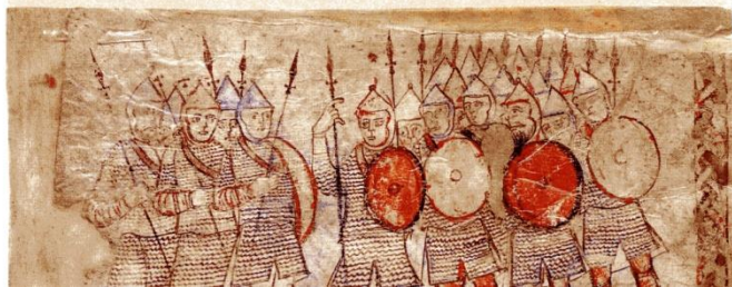
Esercito del principe