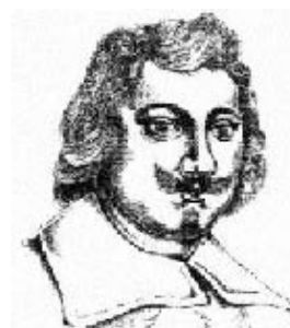
Evangelista Torricelli (1608-1647)

Dico questo solo per sottolineare che l'integrabilità delle funzioni continue è un risultato che (pur non essendo solitamente dimostrato) andrebbe messo nel dovuto rilievo, in quanto non ha solo il significato di esemplificare una particolare classe di funzioni integrabili, ma gioca un ruolo chiave nella teoria: su di esso si basa il teorema mediante il quale calcoliamo effettivamente gli integrali. ❖