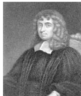
Isaac Barrow (1630-1677)