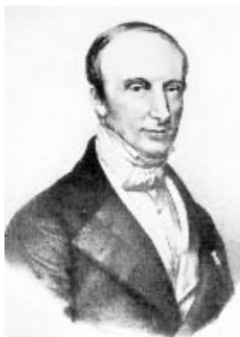
Augustin-Louis Cauchy (1789-1857)

Le somme di Cauchy-Riemann, a ogni modo, traducono anche il tanto ama-