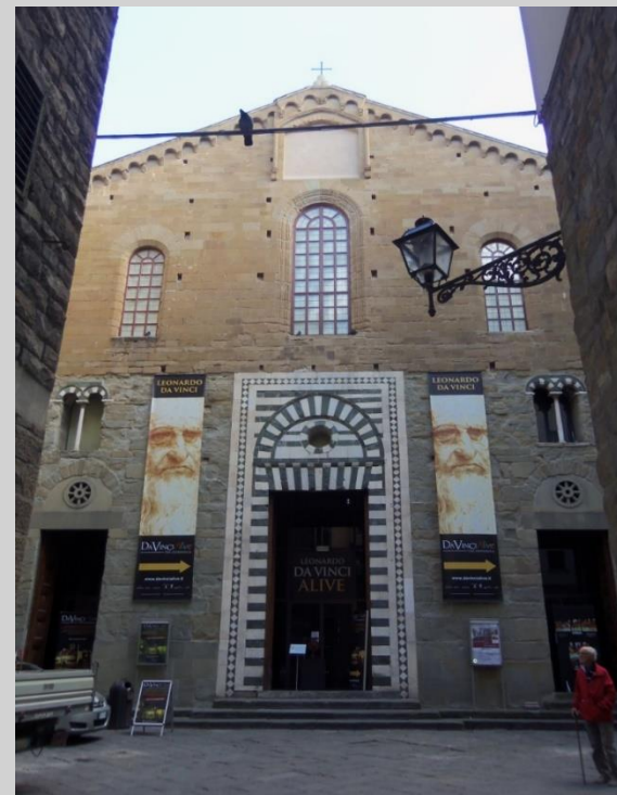
Chiesa di S. Stefano al Ponte (707)

Nel 1808, anno della soppressione napoleonica e della sconsecrazione di San Pancrazio... dopo anni di degrado e un grande incendio nel 1988 divenne spazio museale, sotto il nome di Marino Marini. Fu ristrutturato dagli architetti Bruno Sacchi e Lorenzo Papi, i quali dovettero innestarsi su un parziale intervento già operativo negli anni precedenti, che aveva visto la demolizione della facciata interna barocca e l'elevazione di due tralici a sostegno di una nuova copertura del vestibolo. L'unico settore dove il progetto odierno ha dovuto intervenire con una reinvenzione radicale è la parete di fondo, corrispondente all'antico coro di cui non rimanevano vestigia alcuna, risolta con una "parete di luce".