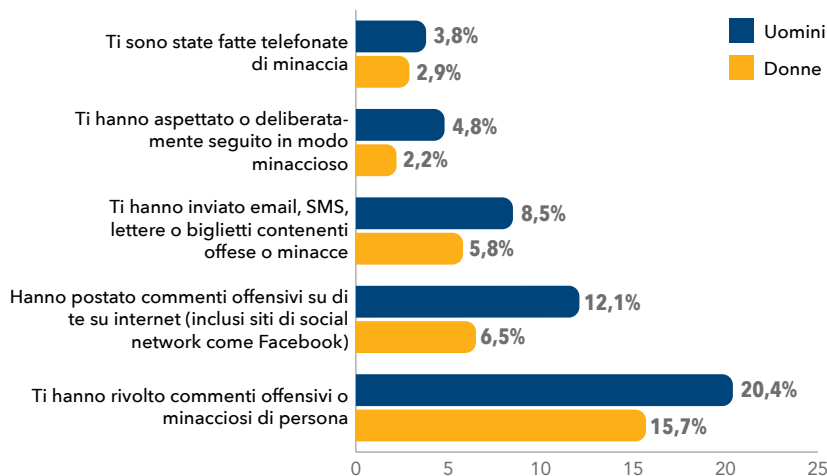
Figura 1. Rapporto in percentuale tra uomini e donne ebrei che hanno vissuto vari tipi di episodi antisemiti negli ultimi 12 mesi. Agli intervistati è stato chiesto se avessero subito gli episodi di cui sopra.