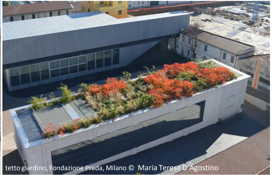
tetto giardino, Fondazione Prada, Milano