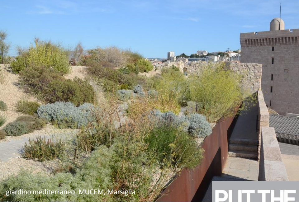
giardino mediterraneo, MUCEM, Marsiglia