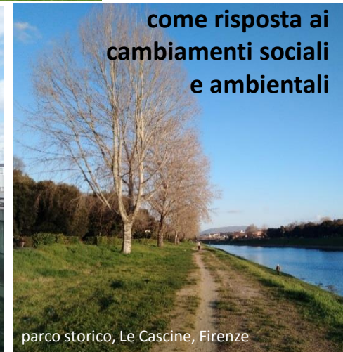
parco storico, Le Cascine, Firenze

come risposta ai cambiamenti sociali e ambientali