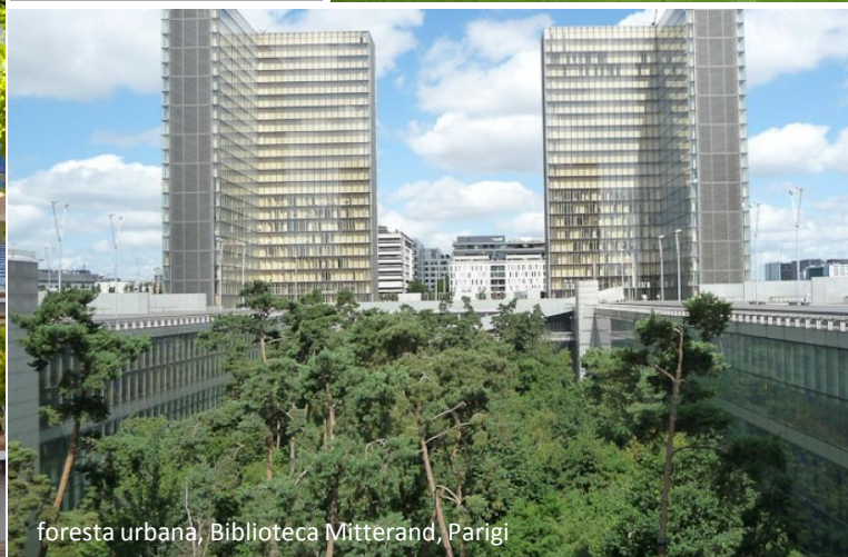
foresta urbana, Biblioteca Mitterand, Parigi

insieme di spazi aperti = SISTEMA con ruolo strutturante per nuovi PAESAGGI URBANI