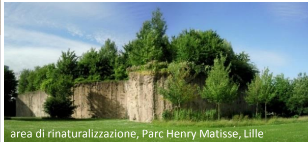
area di rinaturalizzazione, Parc Henry Matisse, Lille

insieme di spazi aperti = SISTEMA con ruolo strutturante per nuovi PAESAGGI URBANI