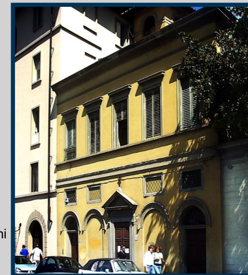
Oratorio S. Maria delle Grazie (732) AUO: S. Croce-

Ex convento di San Marco, nato nel 1100 da un monastero. Restaurato nel 1437 ad opera di Michelozzo e dal 1869 sede del Museo Nazionale di San Marco