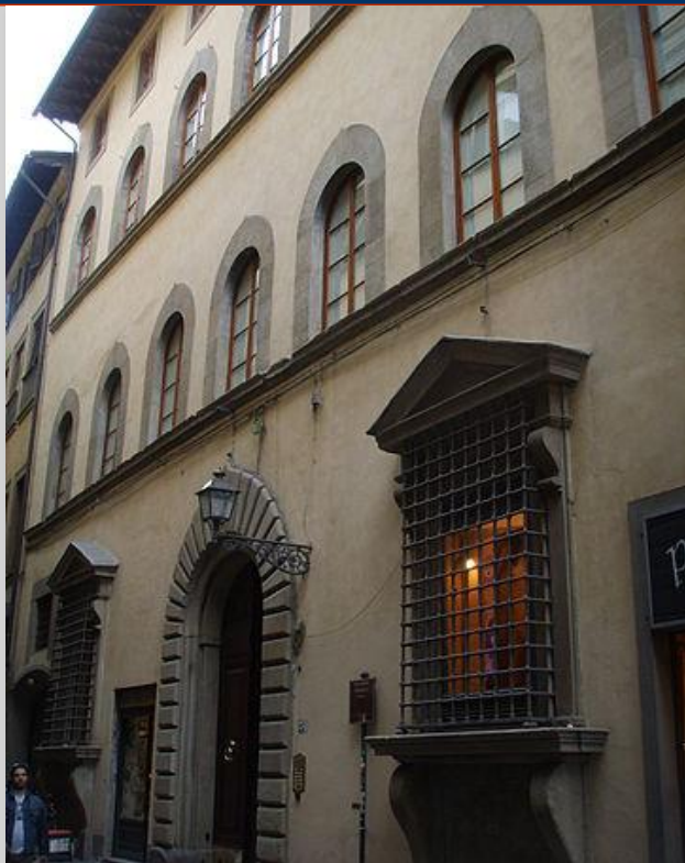
Palazzo Tanagli (701)

..belle forme conferitegli dagli interventi cinquecenteschi, la facciata si sviluppa su sette assi con finestre centinate. Nato dall' unione di tre differenti antiche case medievali.