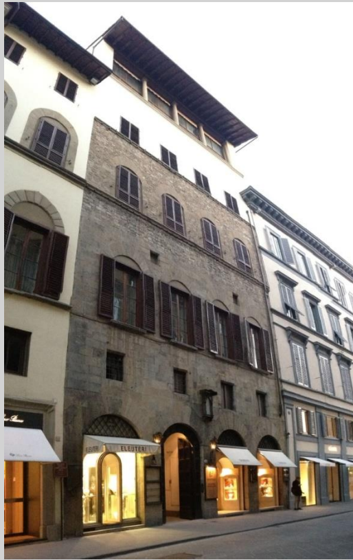
Palazzo Cambi del Nero (717)

Fu edificato fra il XIII ed il XIV secolo. Era un palazzo turrato, ma in una sopraelevazione del XV secolo furono tolti i merli ed aggiunto un piano con la loggia. Appartenne anche agli Strozzi ed ai Medici.