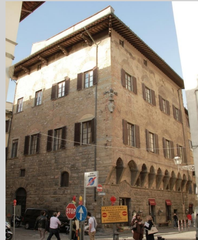
Palazzo da Cintoia (743)

costruzione del XIV secolo. Nel 1895 l'edificio fu parzialmente ricostruito dalla ditta "Simonelli e C." in stile medioevale. Della struttura originaria resta solo la parte inferiore con lo scudo quattrocentesco degli Anselmi e quello della famiglia Ristori del 1893.