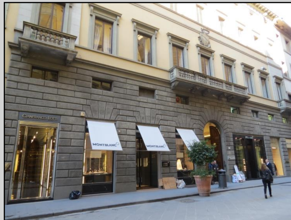
PALAZZO ALAMANNI (760) Via de' Tornabuoni 9