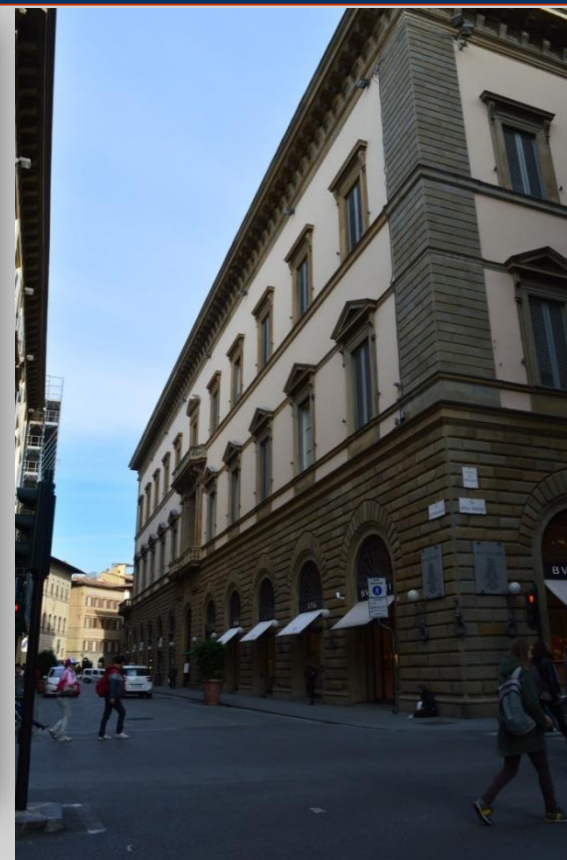
Palazzo Tornabuoni-Corsi (710)

L'edificio si trova in via del Sole 11, angolo piazza S. M. Novella. Palazzo cinquecentesco per la decorazione classicista in facciata, assume la configurazione attuale grazie a Bernardo da Magnale.