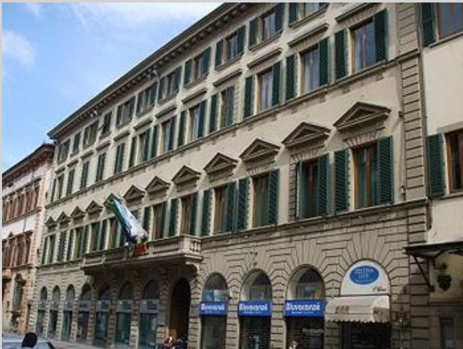
PALAZZO BASTOGI (769) via Cavour 18