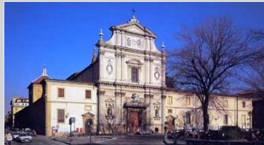
Basilica di San Marco (725) AUO: S. Marco

Commissionata dai monaci Vallombrosani, la Chiesa fu fondata nella metà del XI secolo in stile romanico ma ampliata e ristrutturata in stile gotico (1250-1258). La facciata è stata rifatta nel '500 da Bernardo Buontalenti con sculture di Giovanni Coccini.