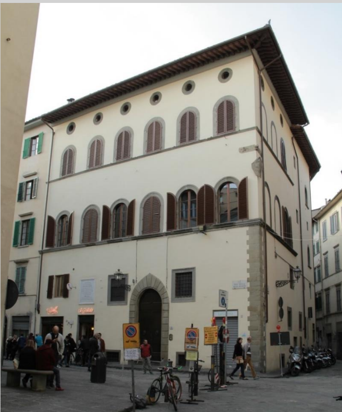
Palazzo Lottini (742) AUO: S. Croce Centro

.. disegno d'insieme che riconduce la costruzione al tardo Quattrocento.... un terzo piano sottotetto presenta piccoli occhi circolari con cornici di pietra