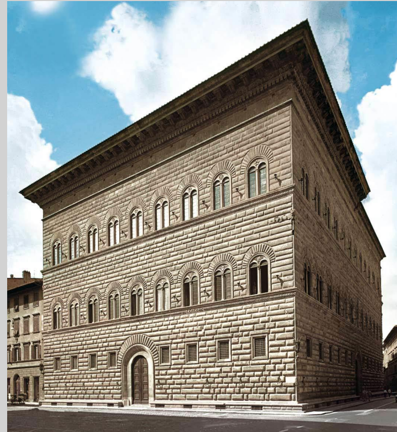
Palazzo Strozzi (714)