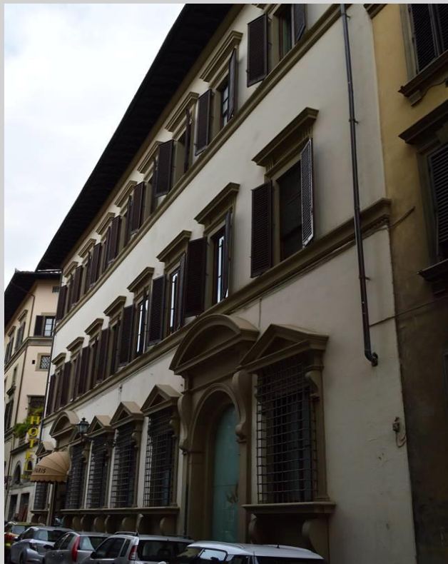
Palazzo Doni (766)

.. fine 500-inizio 600 tardo manierista. Opera attribuita a Gherardo Silvani.