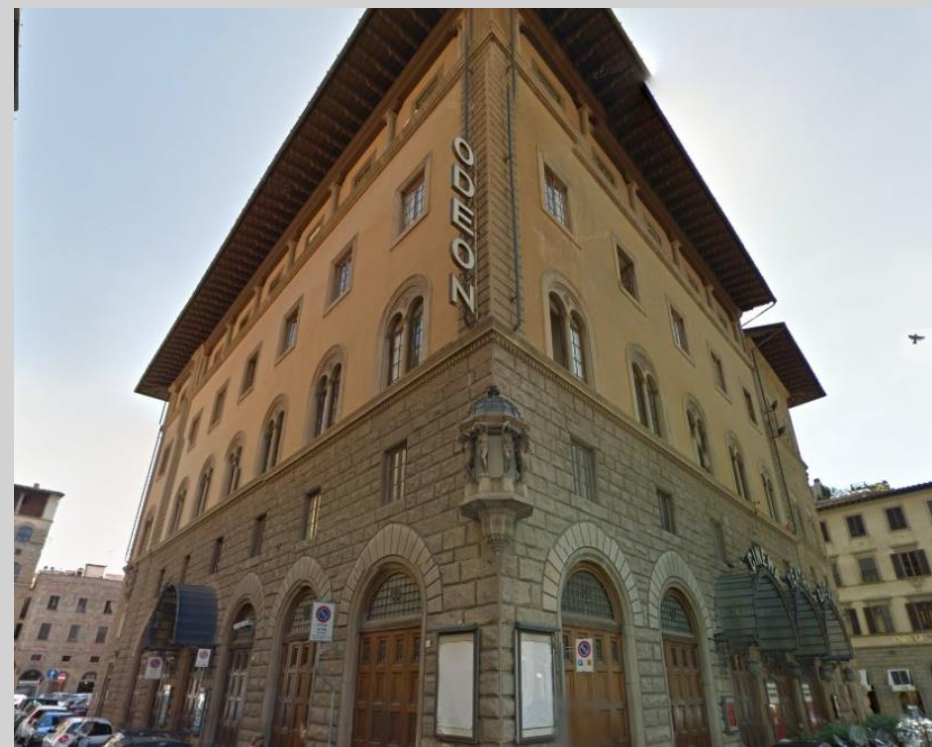
Palazzo dello Strozzi - Cinema Odeon - (718) - AUO: S. Giovanni

.. disegno d'insieme che riconduce la costruzione al tardo Quattrocento.... un terzo piano sottotetto presenta piccoli occhi circolari con cornici di pietra