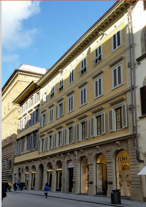
Palazzo Altoviti Sangalotti (716)

... Caffè Doney dal 1827 ha rappresentato uno dei luoghi simbolo della città... La sua prestigiosa posizione, di fianco a palazzo Strozzi lungo via Tornabuoni, l'ha reso una delle mete preferite dell'alta borghesia fiorentina e straniera.