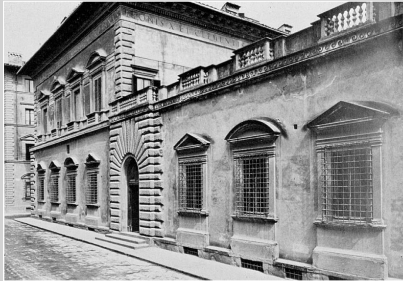
Palazzo Pandolfini (724)

Realizzato dalla famiglia di architetti da Sangallo, su disegno di Raffaello, nel 1520.