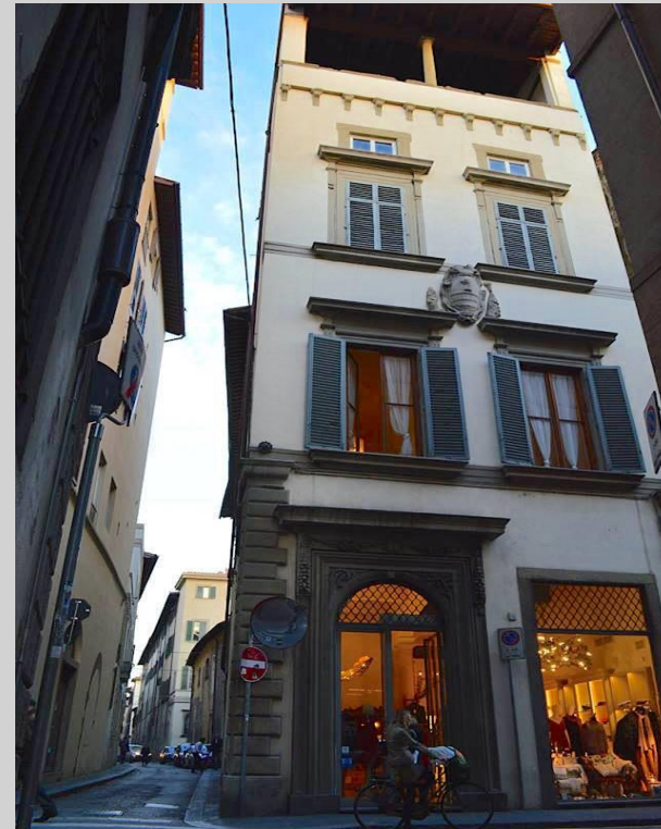
Casa Carlini (723)

Fu edificato fra il XIII ed il XIV secolo. Era un palazzo turrato, ma in una sopraelevazione del XV secolo furono tolti i merli ed aggiunto un piano con la loggia. Appartenne anche agli Strozzi ed ai Medici.