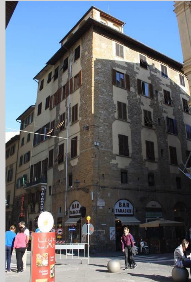
Torre dei Filipetri (728)

.. presumibilmente di età due-trecentesca, era originariamente proprietà del convento della Badia e nel 1497 divenne sede della famosa stamperia dei Giunti. Dal 600 ha subito significative modifiche.