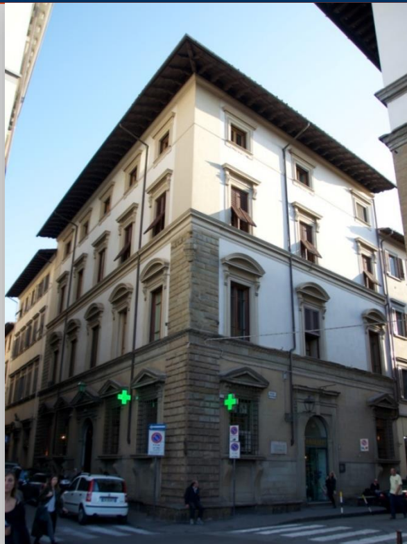
Palazzo Da Magnale (756)

..belle forme conferitegli dagli interventi cinquecenteschi, la facciata si sviluppa su sette assi con finestre centinate. Nato dall' unione di tre differenti antiche case medievali.