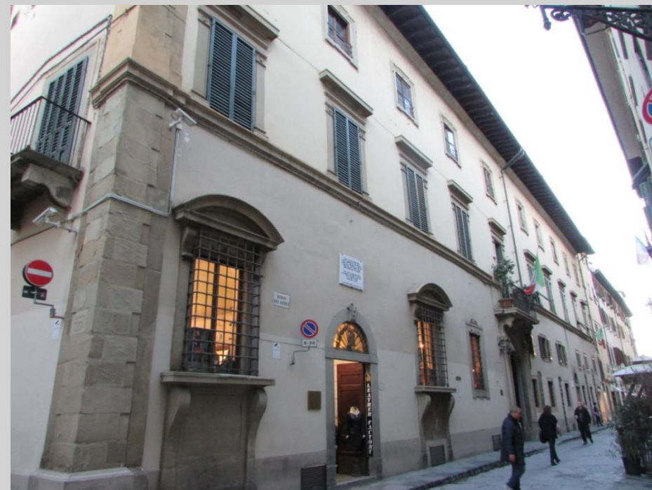
Palazzo di Ubaldino Peruzzi (740)

.. fine 500-inizio 600 tardo manierista. Opera attribuita a Gherardo Silvani.