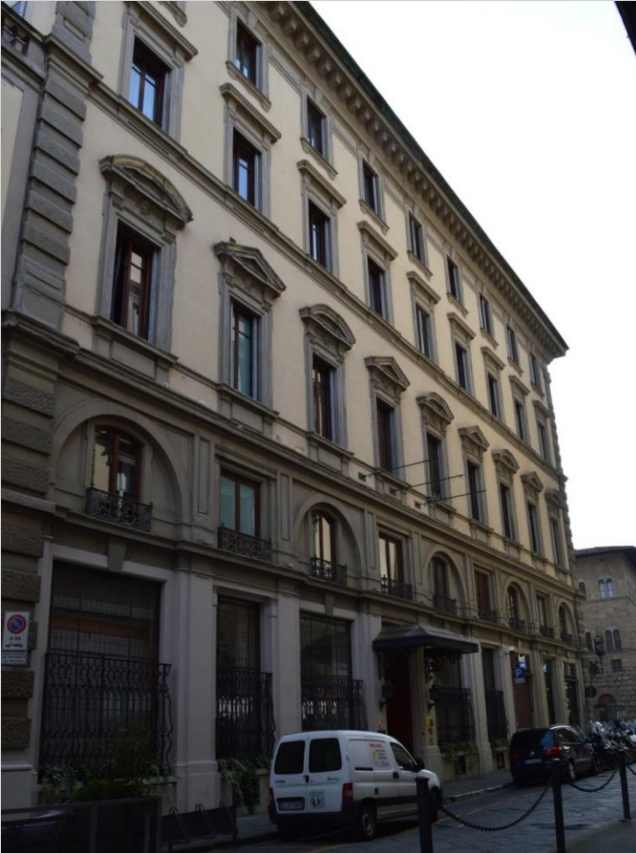
Albergo Helvetia & Bristol (711)

..fu commissionato nel 1895... edificio di sobria architettura ispirata ad esempi cinquecenteschi.