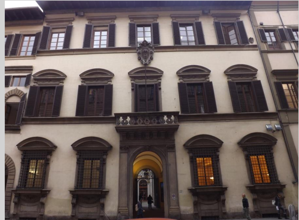
Palazzo Capponi Covoni (771)

... Caffè Doney dal 1827 ha rappresentato uno dei luoghi simbolo della città... La sua prestigiosa posizione, di fianco a palazzo Strozzi lungo via Tornabuoni, l'ha reso una delle mete preferite dell'alta borghesia fiorentina e straniera.