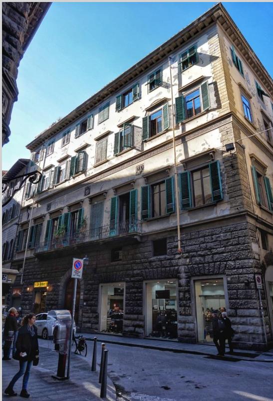
Palazzo Niccolini (720)

risale al 1200-1300 e solo nel 1537 divenne di proprietà della famiglia Niccolini, di cui oggi porta il nome.