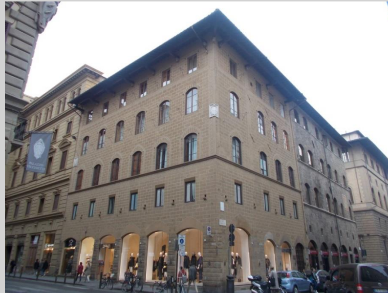
Palazzo Anselmi-Ristori (715)

risale al 1200-1300 e solo nel 1537 divenne di proprietà della famiglia Niccolini, di cui oggi porta il nome.