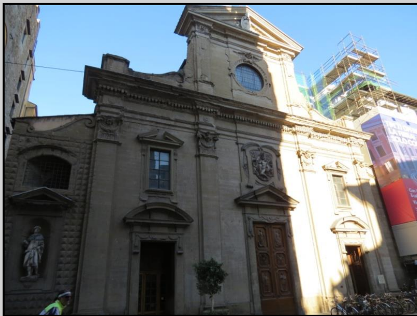
Basilica Santa Trinita (759) AUO: Tornabuoni

Commissionata dai monaci Vallombrosani, la Chiesa fu fondata nella metà del XI secolo in stile romanico ma ampliata e ristrutturata in stile gotico (1250-1258). La facciata è stata rifatta nel '500 da Bernardo Buontalenti con sculture di Giovanni Coccini.