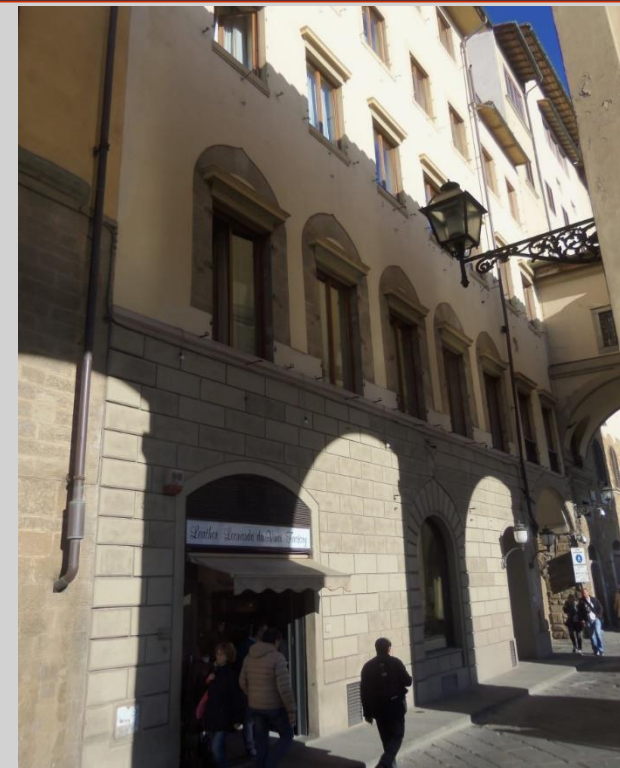
Hotel degli Orafi (706)