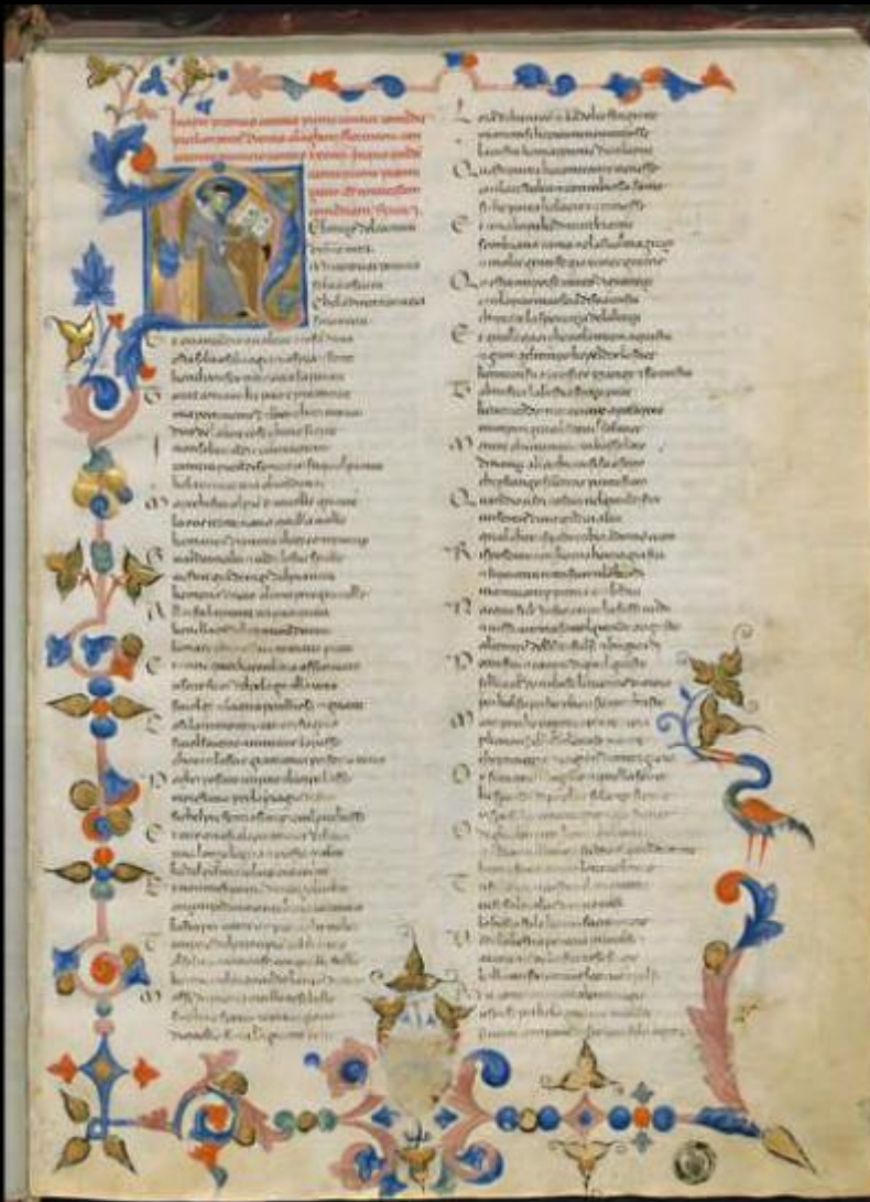
Firenze, BML, Plut. 40.13 Maestro delle Effigi Domenicane