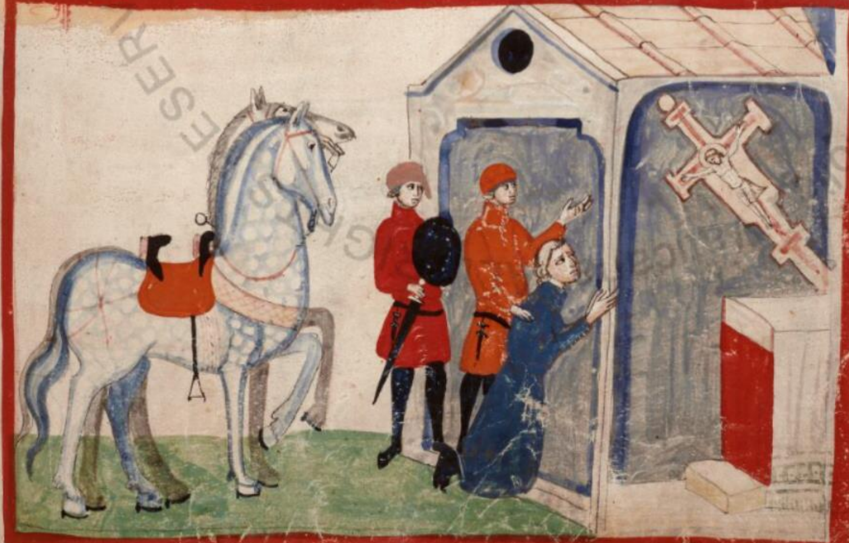
c. 53r, Miracolo di san Giovanni Gualberto