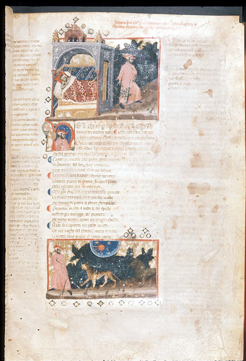
Dante incontra le tre fiere nella selva e Virgilio Inf. I canto, f. 1r