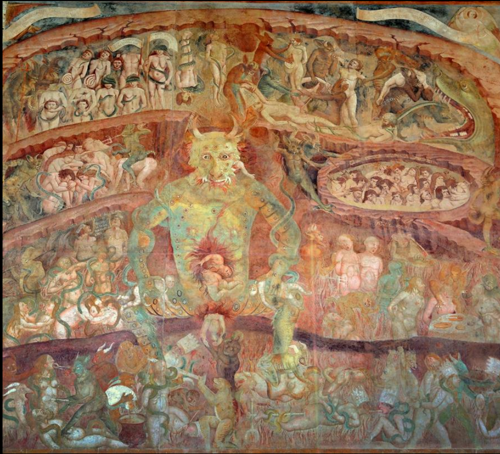
Buonamico Buffalmacco, Inferno , Pisa, Camposanto