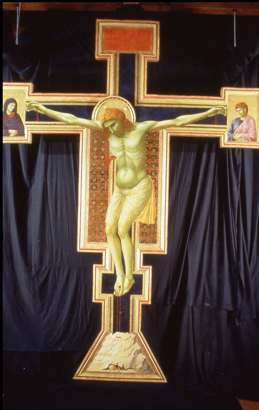
Giotto, Croce, Firenze, Santa Maria Novella