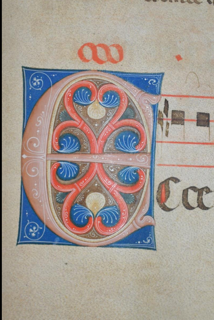
Iniziale E (Ecce), 1280c., San Romano (Montopoli, Pisa), santuario di Maria Madre della Divina Grazia, Museo, Graduale, s.s., f. 143r