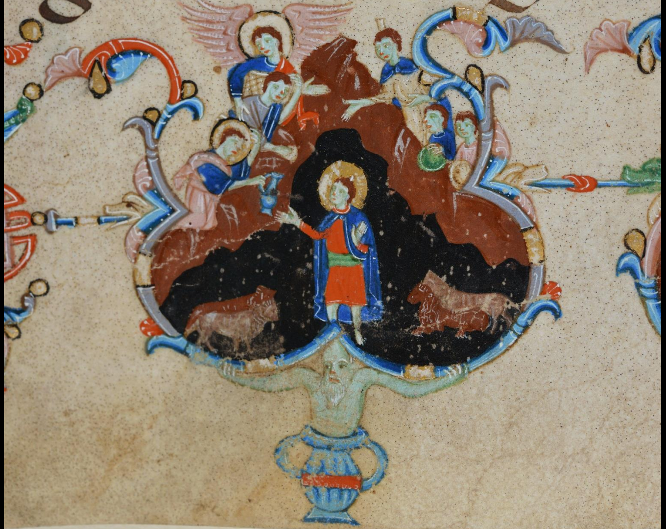
Daniele 6, 10-24