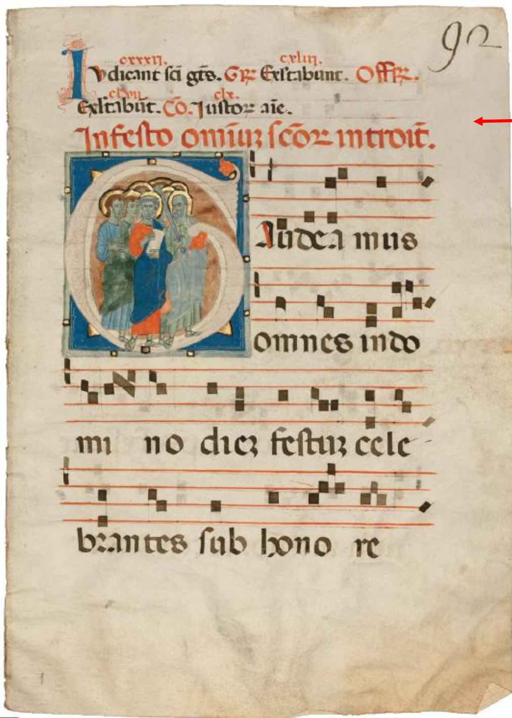
Graduale, Pistoia, museo diocesano, San Paolo, CXIV.85