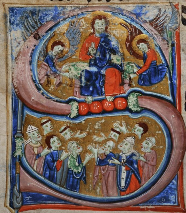
In natalis plurimorum martirum a pascha usque pentecostem, ubi alius non assignatur

Ancor tu domine te ne dicent te glonam te