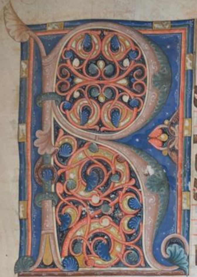
Iniziale R ( Resurrexi ), 1275-80c., San Romano (Montopoli, Pisa), santuario di Maria Madre della Divina Grazia, Museo, Graduale, s.s., f. 167r.