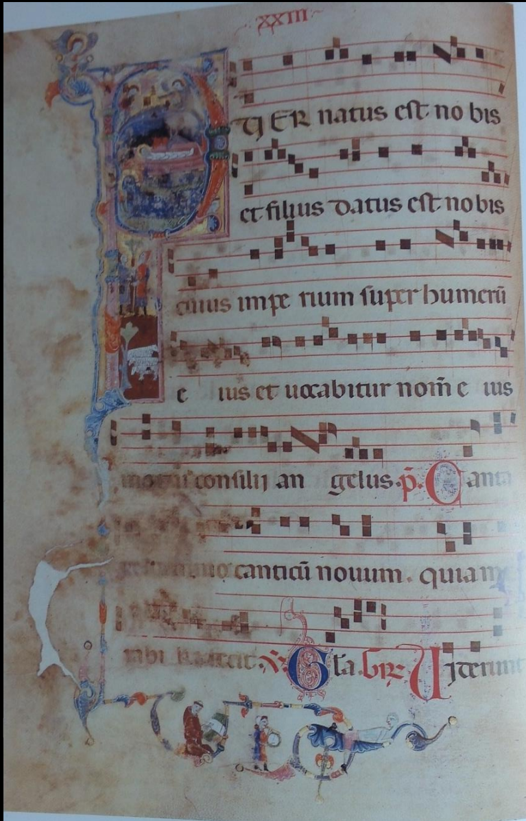
EMPOLI, Graduale con il Proprio del Tempo per tutto l'Anno liturgico