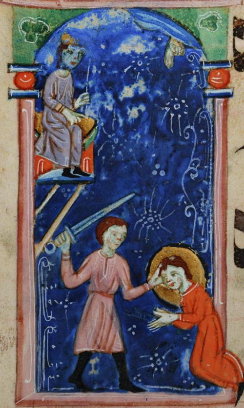
Martire non pontefice

Virtute tu a domine leta bitur in suis et su per salu tare tu um exulta uit uehementer desiderium anime eius tribui sti ei. Q uoniam puenisti eu in bene dictionibus dulcedinis. posuisti in ca pite eius coronam de lapide pretio