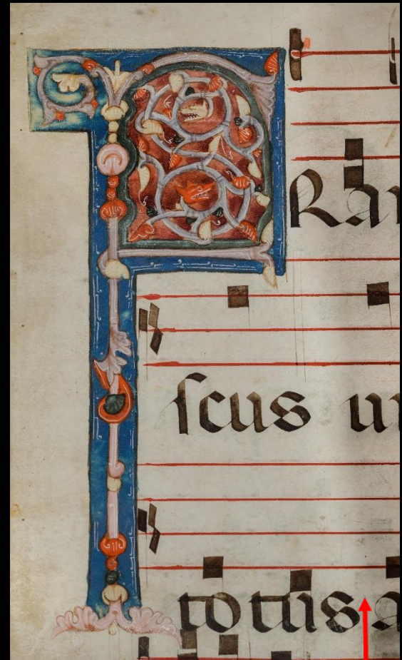
Antifonario, Pistoia, museo diocesano, San Paolo, CXIV.87