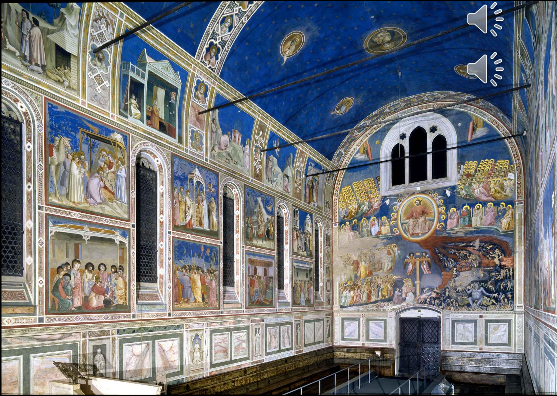
Giotto, cappella di Enrico Scrovegni, Padova