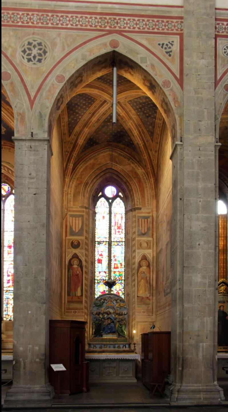
CAPPELLA PULCI BERARDI Dedicata ai santi Stefano e Lorenzo Affrescata da Bernardo Daddi 1325 circa