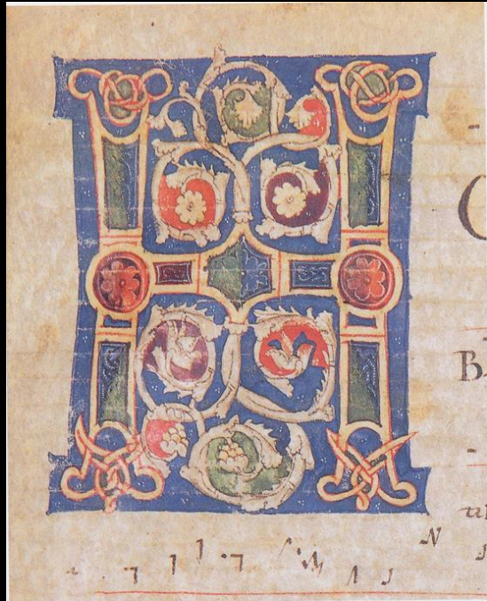
Iniziale H dall'antifonario di Santa Maria del Fiore

EST AUTEM POST QUAM MOR tuus e' saul. ut d' reuer teretur. aede amalech. et manere. in iet' eel duosier. Indicaui' eta. apparuit ho ueniens de cultris saul. ueste e' f'ra et puluere aspersus caput. Et uenit ad d'. eedite sup facie sua et adorauit. Dixitq. ad eu' d'. Unde uenit. Qui ait. ad eu' d'. Deultris isrl' fugi. Et dixit ad eu' d'. Qd' est uerbu' qd' factu' e'. Indica mibi Qui ait. Fugit ppls de p'lo. et multi corruentes e' p'lo mor tuu sunt. sedet saul. et ionathas filius eius inter. Dixitq. d' ad adulescentu' q' nuntiauit ei. Unde f'it q' mortuus e' saul. et io nat'as filius eius. Ait adulescens qui narrauit ei. Cisti ueni in monte gelboe. et saul inebebat sup hastam suam. porro eurrus et equus appropinquabant ei. Et euer' sus post tergum suu. uidens me uo cauit. Cui cu' respondissem adsum. dixit m' q' na' e' tu. Et aio ad eum.