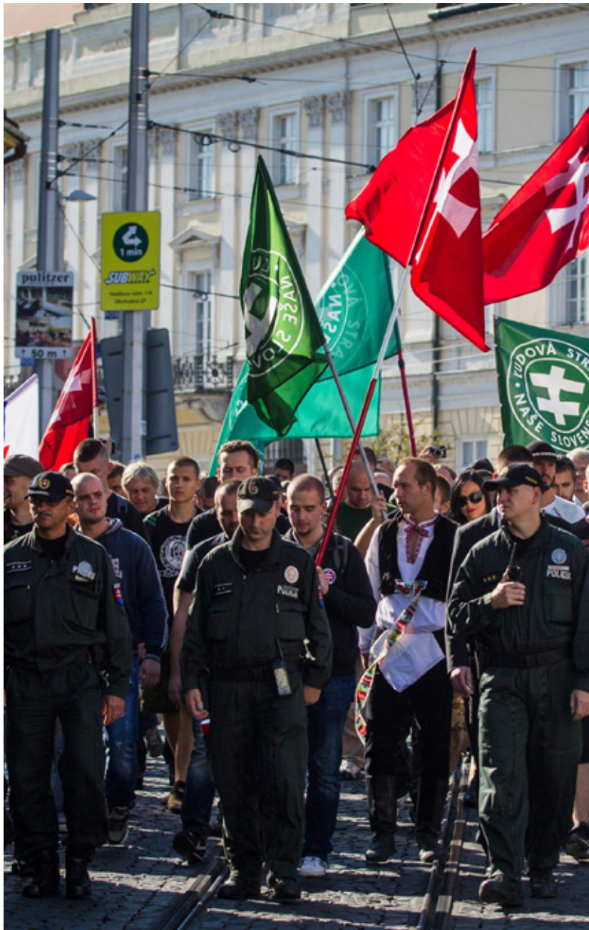
Members of the party “Kotleba – People’s Party Our Slovakia” hold an anti-immigration rally in Bratislava in September 2015