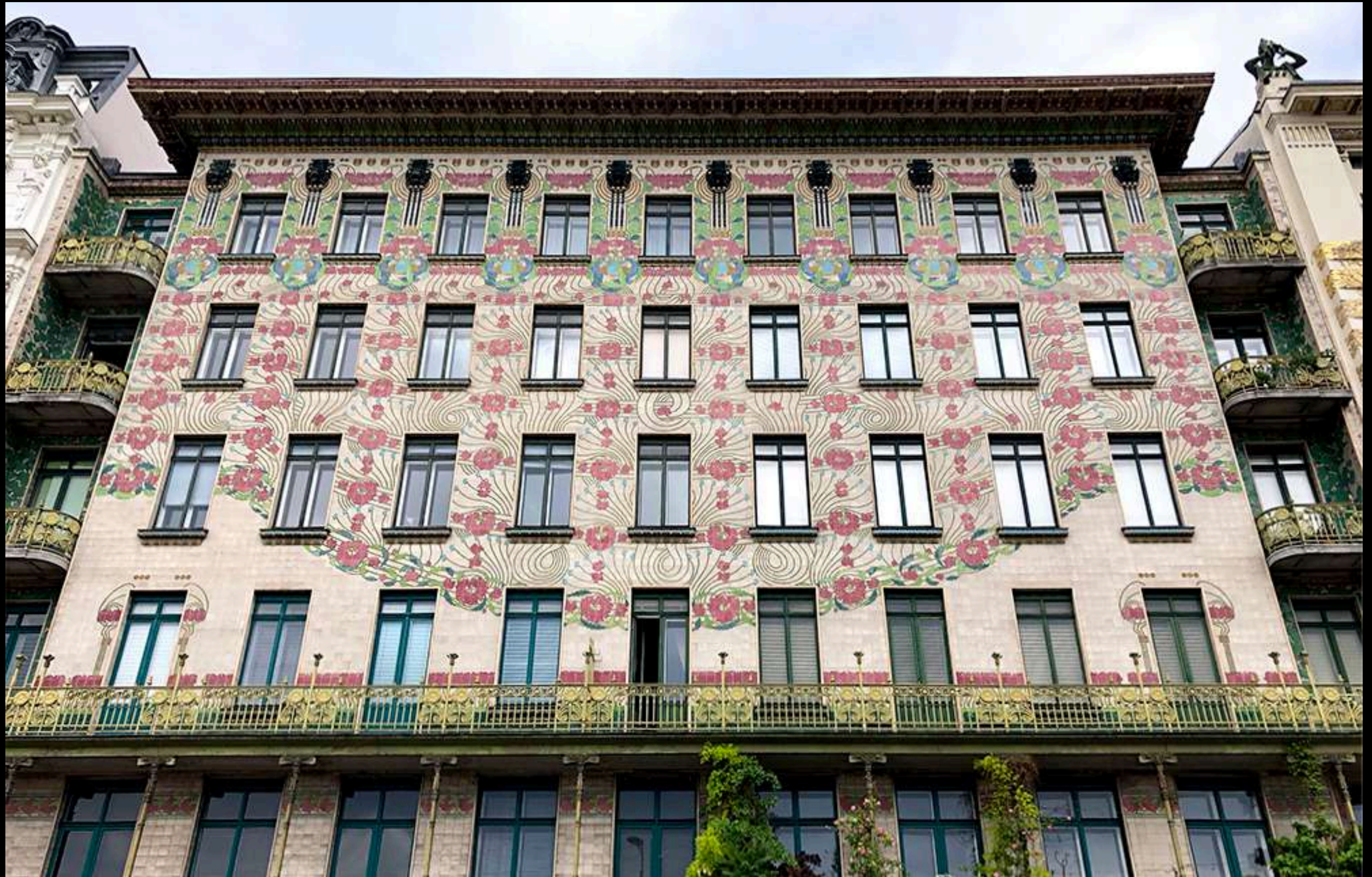
Otto Wagner, Casa Maiolica , Wien 1898-99