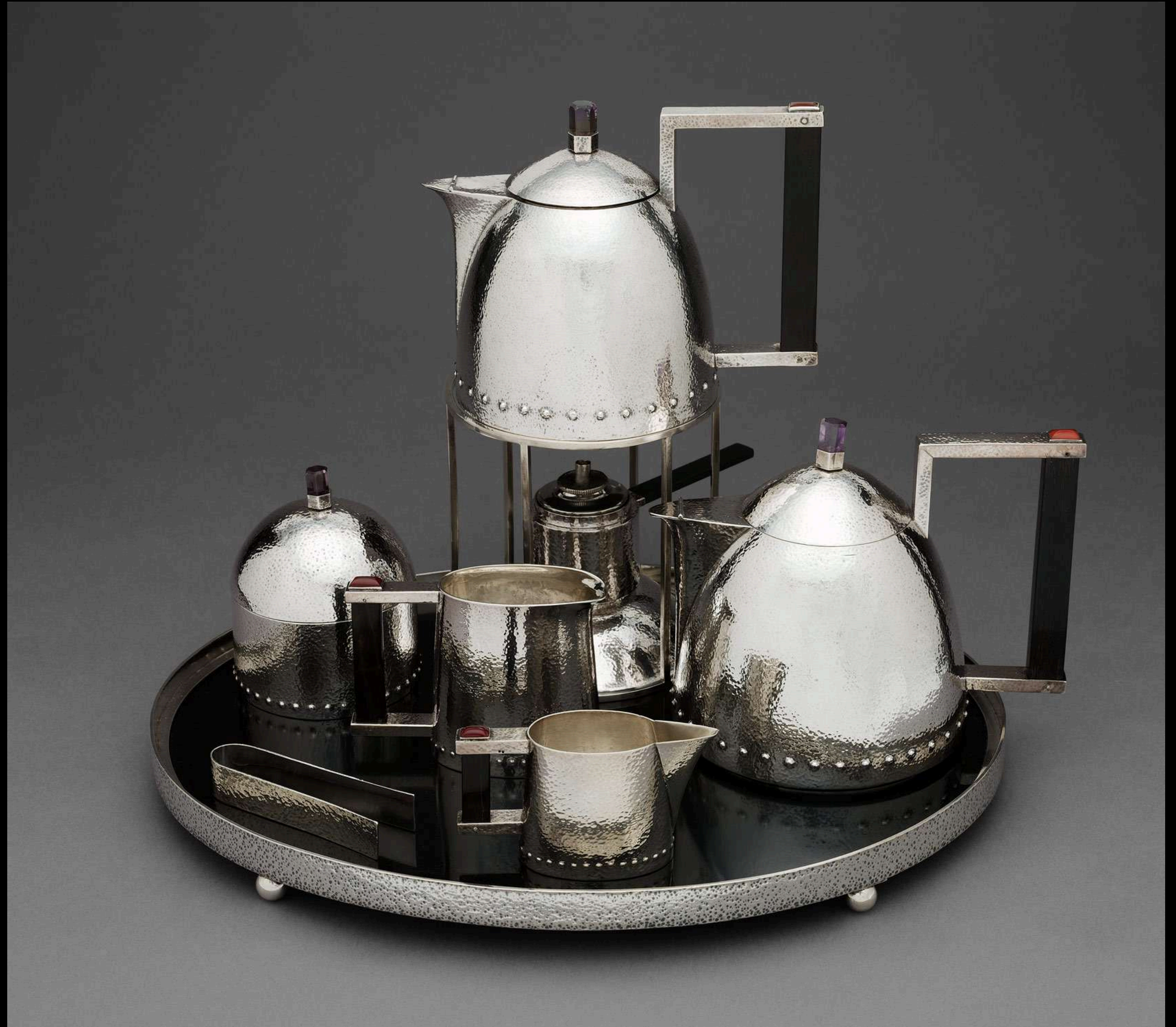
Josef Hoffmann, 1910