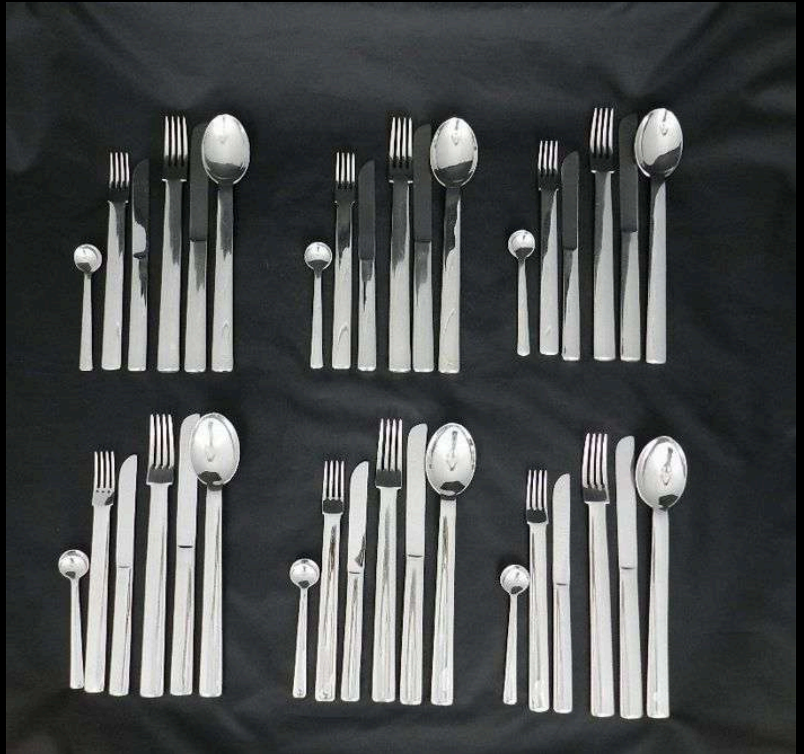
Josef Hoffmann, 1902