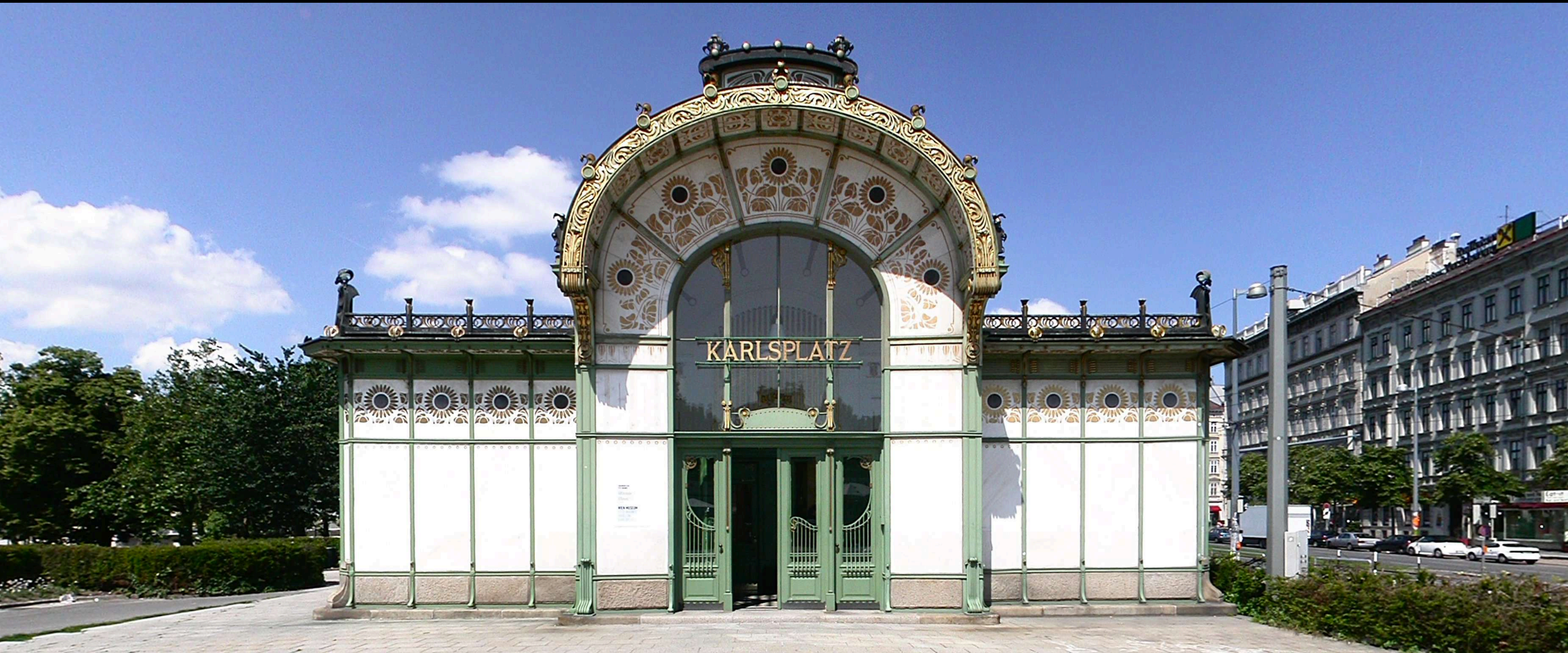
Otto Wagner, Stazione Metropolitana , Wien 1895