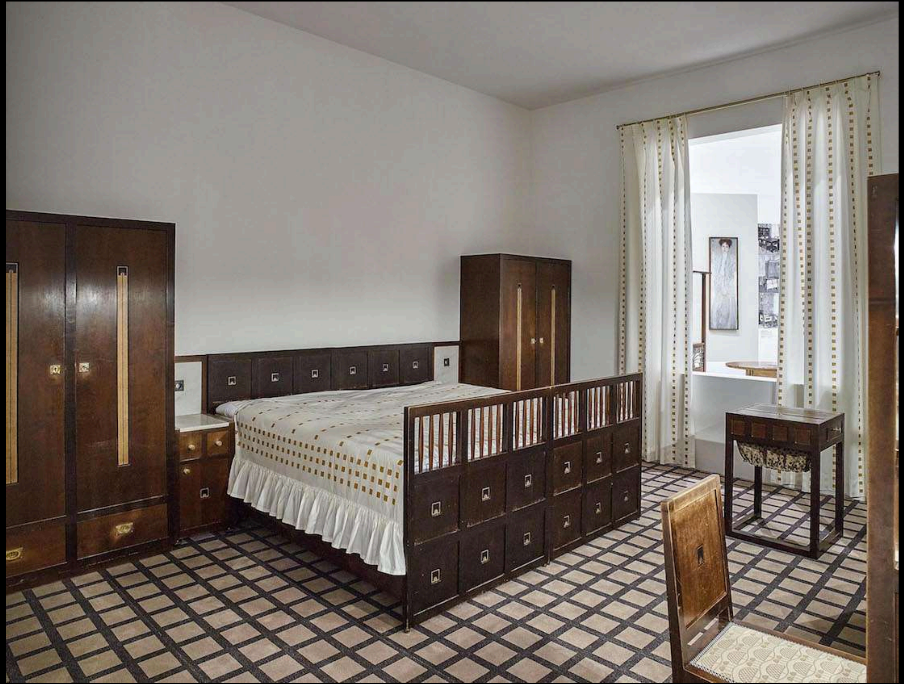
Josef Hoffmann, 1902