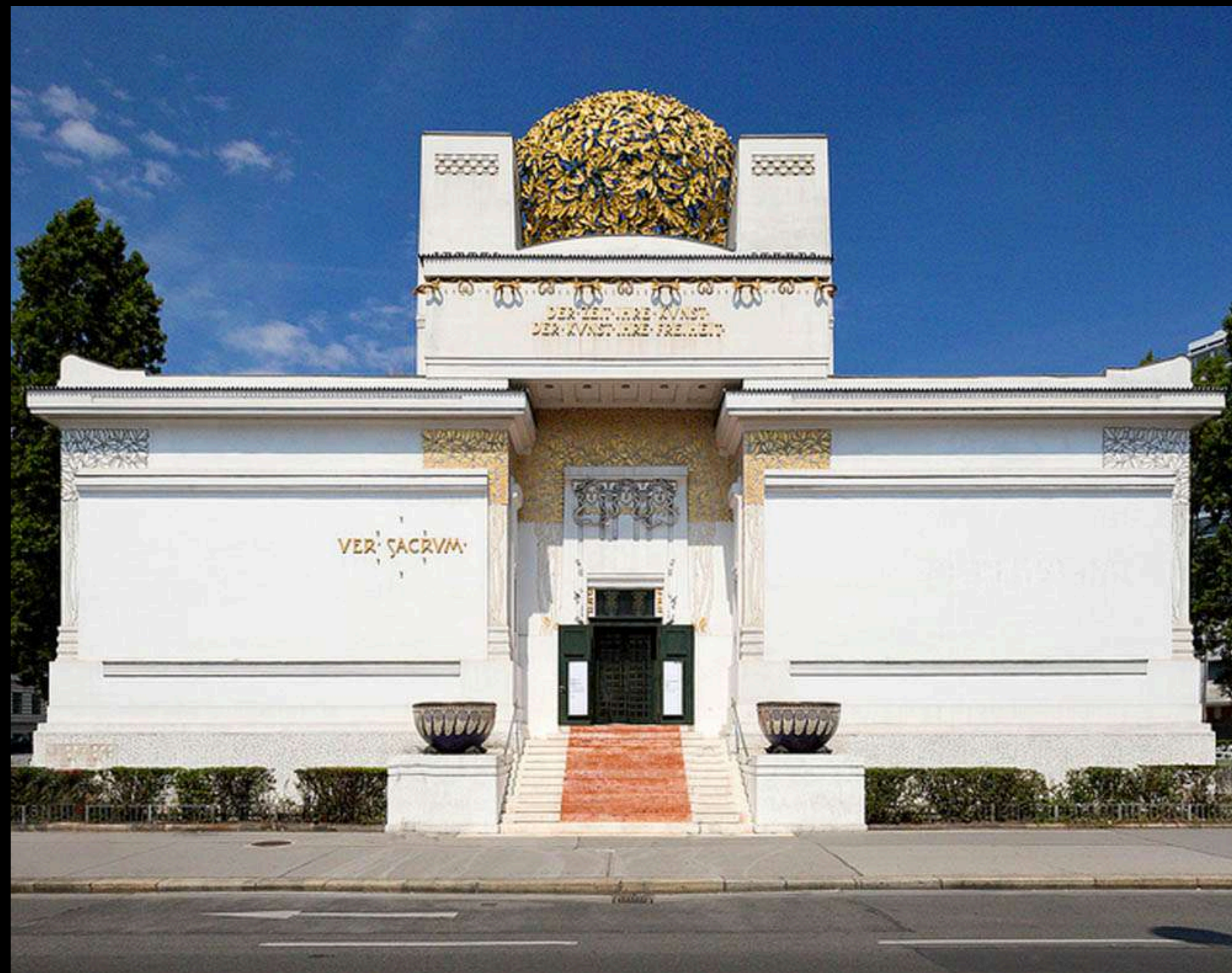
Josef Olbrich, Palazzo della Secessione, Wien 1898