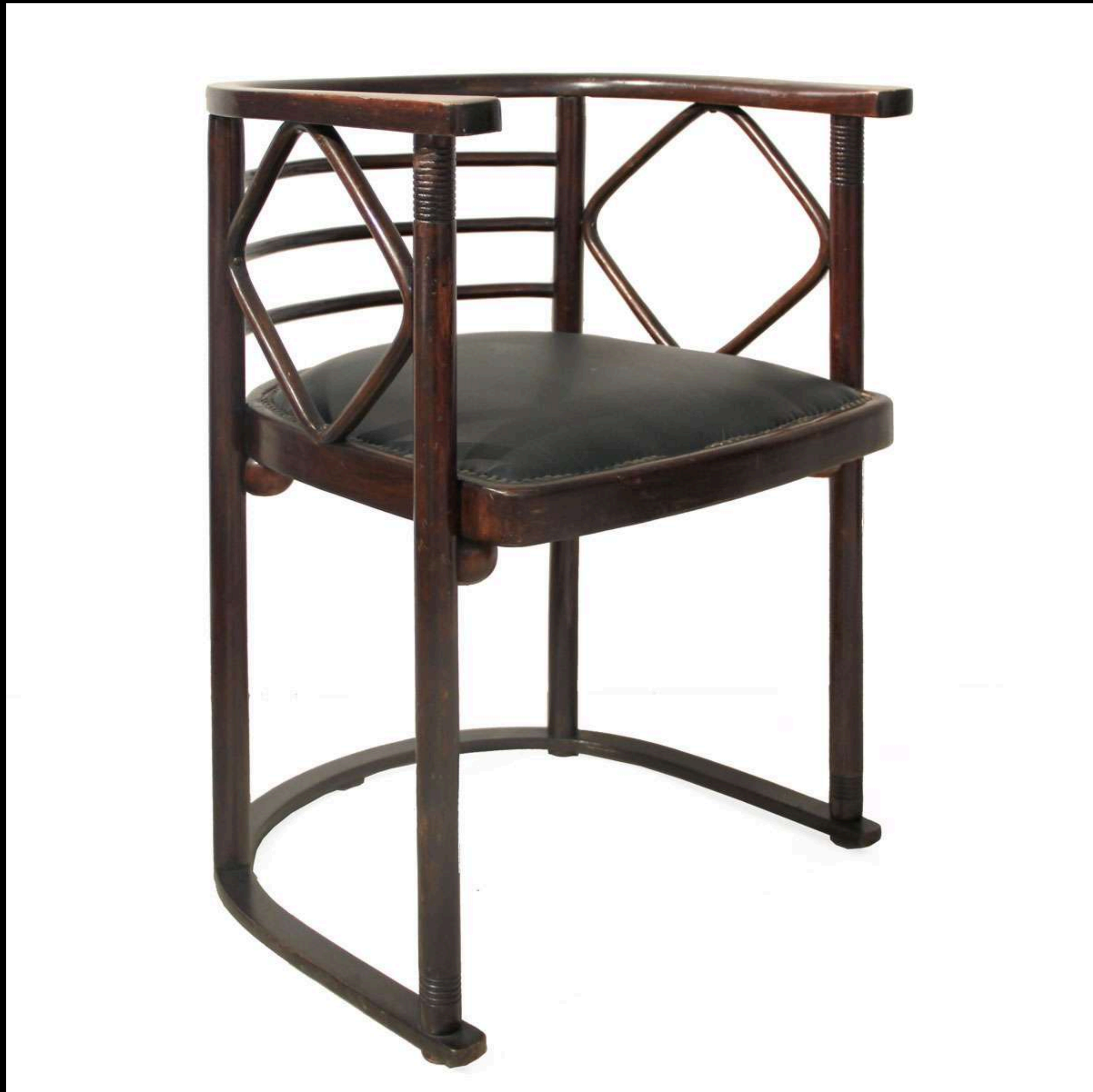
Josef Hoffmann, 1906