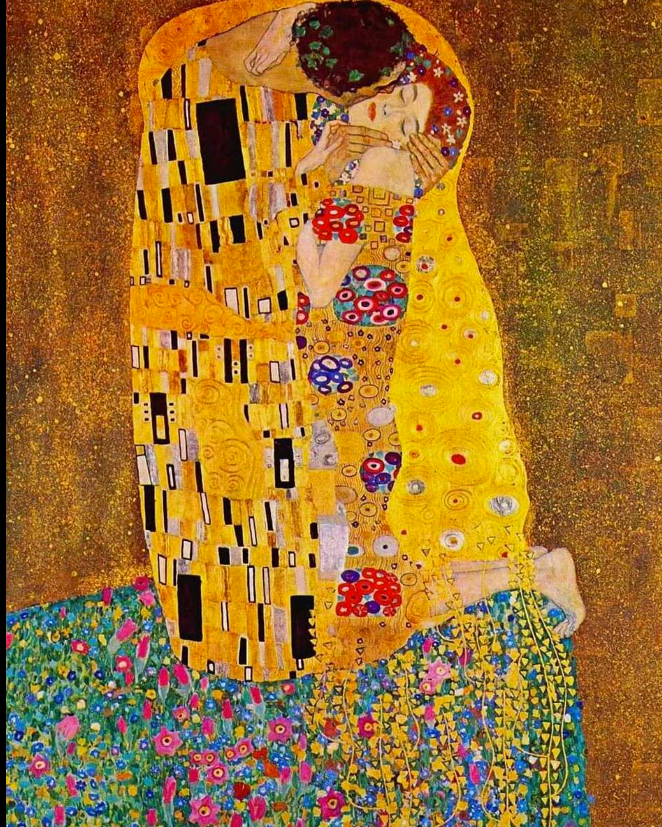
Klimt G., Il bacio, 1907-08