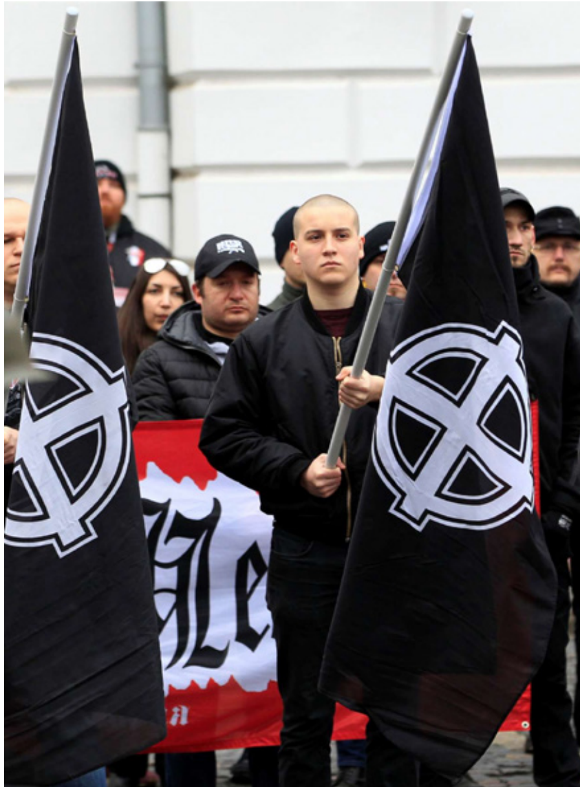
Neo-Nazi groups attend the 'Day of Honor' parade in Budapest in February 2018