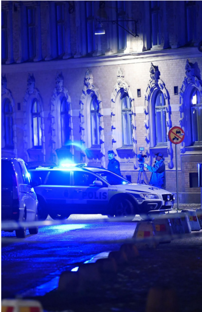
Three individuals threw firebombs at the synagogue on Gothenburg in December 2017