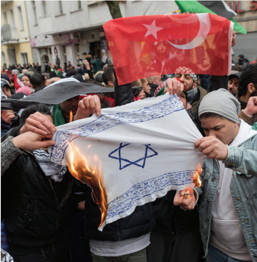
Youths burn an Israeli flag during a demonstration in Berlin's Neukölln district