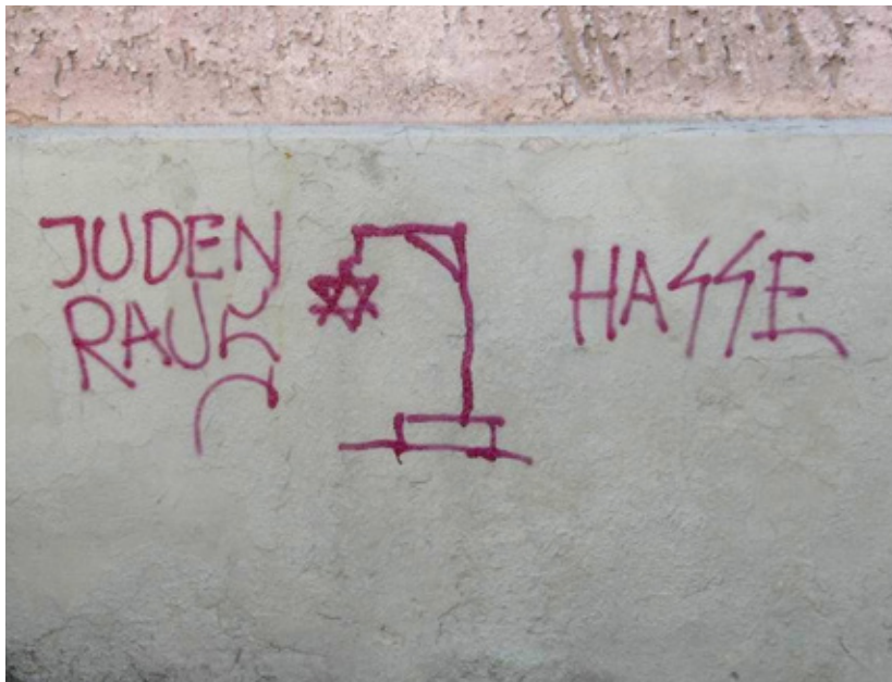
Antisemitic graffiti in Klaipeda, Lithuania