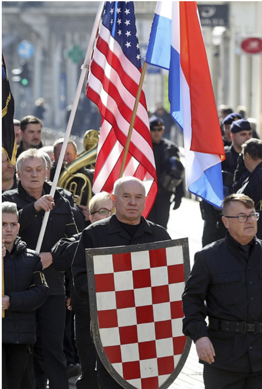
Members of a Neo-Nazi political party march through Zagreb chanting slogans used by Croatia's Pro-Nazi World War II Ustasha regime