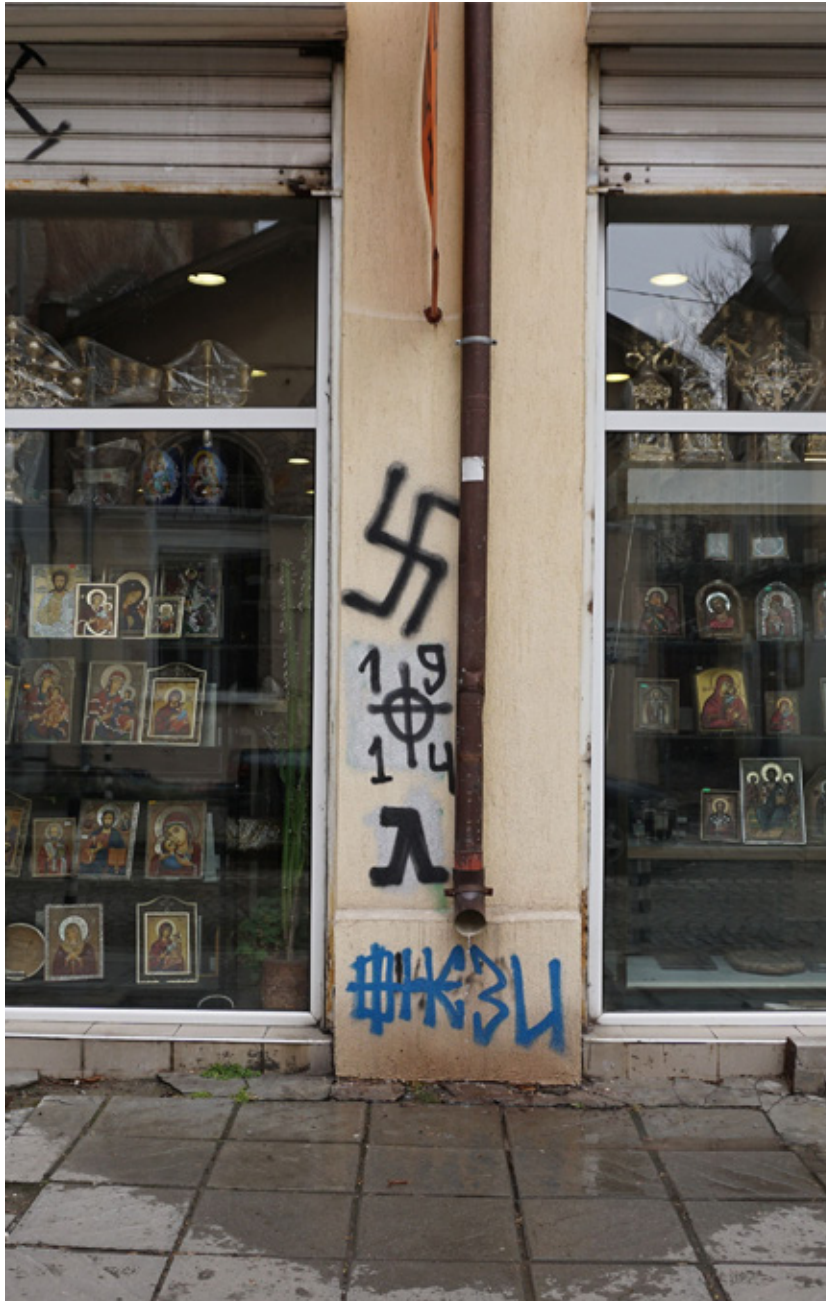
Neo-Nazi graffiti in Sofia, Bulgaria